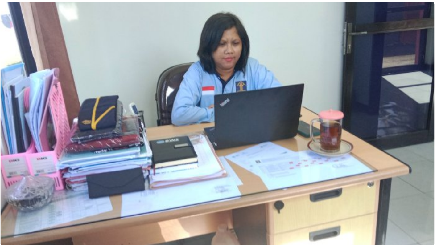
Humas Rupbasan Cilacap

Cilacap - Dalam rangka implementasi NIK menjadi NPWP, Direktorat Jenderal Pajak menggelar edukasi perpajakan secara virtual. Jumat (9/6/2023)